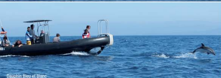
Dauphin Bleu et Blanc