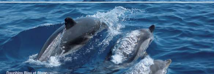
Dauphins Bleu et Blanc