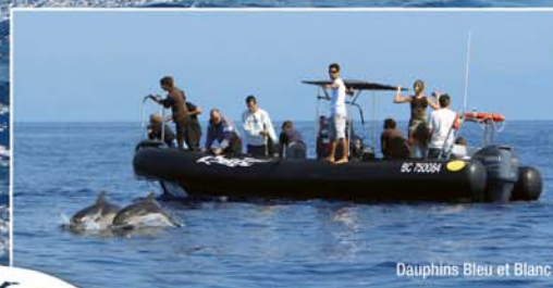
Dauphins Bleu et Blanc